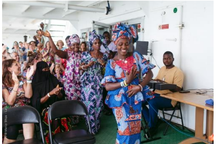
Feest na herstel!

te bieden op haar reizen langs de kust van West Afrika. Een hersteloperatie=een nieuw leven: de urineblaas wordt gedicht en kan weer urine bevatten. De vrouwen worden liefdevol verpleegd, ook weer aangeraakt en geknuffeld. Er wordt veel gepraat, gezongen en gebeden. Helaas kunnen deze hersteloperaties dit jaar niet doorgaan op het hospitaalschip i.v.m. de wereldwijde corona uitbraak. De lange reizen om deze vrouwen uit de periferie op te halen naar het hospitaalschip in de haven zijn verboden. Datzelfde reisverbod zorgt er vermoedelijk ook voor dat méér moeders zullen bevallen zonder professionele hulp, dus met meer gevaar voor hun leven en dat van hun kindje en ook meer kans op een verscheurde urineblaas.